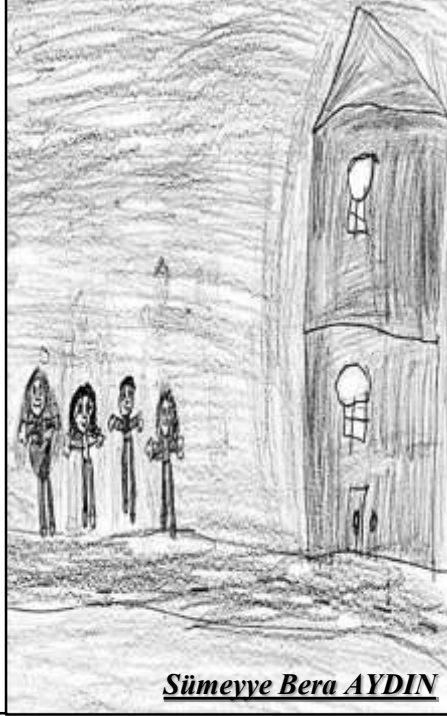
Sümeyye Bera AYDIN